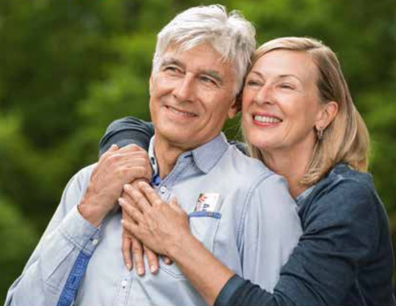
Privatna fotografija predstavlja fotografije stvarnih ljudi. Bil. odobrenja: ALIMS 515-08-00442-19-001